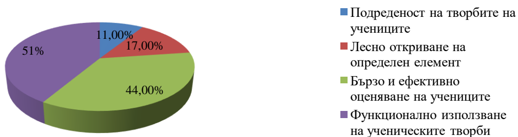
Фигура 3. Какви предимства Ви дава използването на ученическото портфолио в образователно-възпитателния процес?

Открояващ се висок процент от анкетираните учители – 57% посочват, че използват електронно портфолио в учебния процес. 31% от участниците прилагат в образователно-възпитателния процес хартиен вариант на портфолиото. Една малка част от педагозите отново не са споделили своя отговор. (фиг.3)