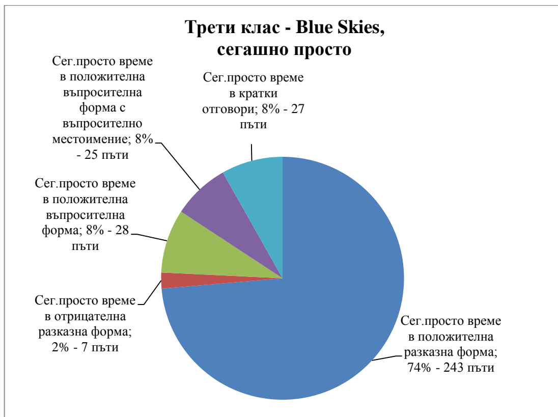
Диаграма 2: Процентно съотношение и бройка на представените синтактични форми в Present Simple Tense в системата Blue Skies for Bulgaria на издателство Longman за III клас.

Ето ги и в процентно съотношение резултатите от преброяването на всички синтактичните форми със сегашно продължително и сегашно просто време в трети клас в Blue Skies for Bulgaria на издателство Longman.