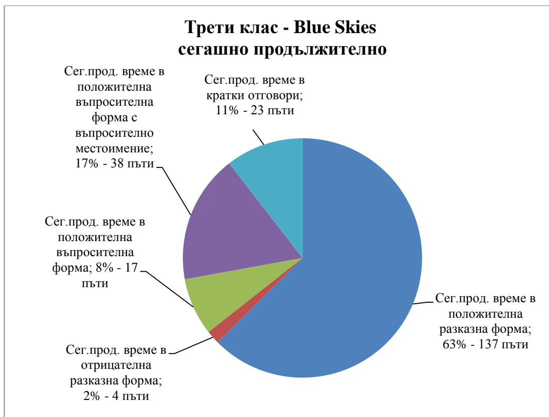
Диаграма 1: Процентно съотношение и бройка на представените синтактични форми в Present Continuous Tense в системата Blue Skies for Bulgaria на издателство Longman за III клас.

Дизайнът на метода е измерващо описателен контент-анализ на синтактичните структури в сегашно просто и сегашно продължително време. Основен инструмент на изследването е преброяване на различните синтактични структури в разглеждания учебен комплект, който включва учебник и учебна тетрадка. Преброяването включва пълния текст на учебника и тетрадката, което означава упражненията за четене, за писане, слушане и говорене и инструкциите към тях.