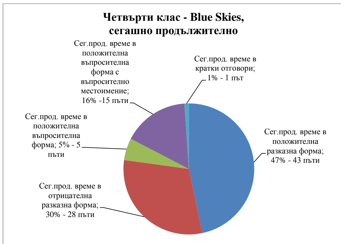
Диаграма 3: Процентно съотношение и бройка на представените синтактични форми в Present Continuous Tense в системата Blue Skies for Bulgaria на издателство Longman за IV клас.

Анализът на синтактичните форми за четвърти клас по учебниците „Blue skies” на издателство Longman, в проценти показва следното: